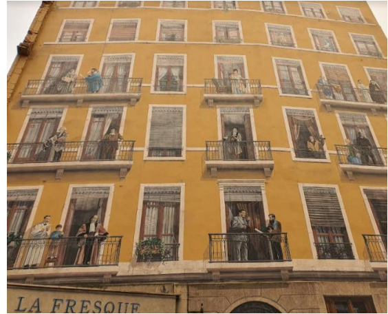
La fresque des Lyonnais.