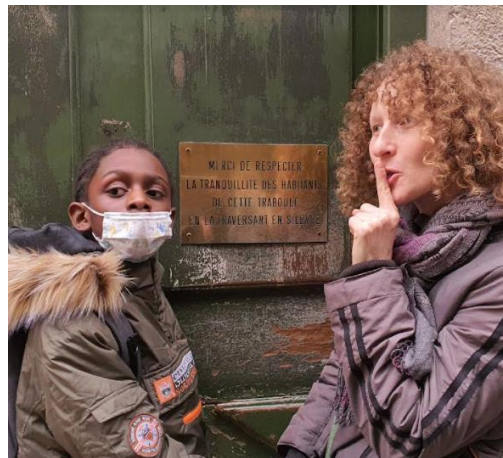
L'entrée d'une traboule : silence ... !