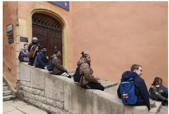
On attend 11h00 pile que l'horloge s'anime.