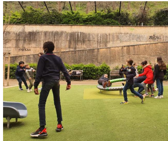
Pique-nique et jeux.