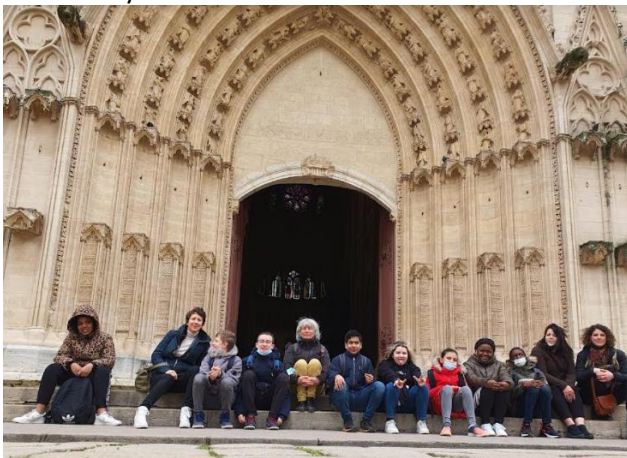
La Cathédrale Saint-Jean.