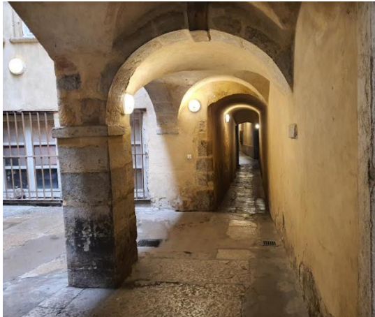
Les traboules et miraboules du Vieux-Lyon.