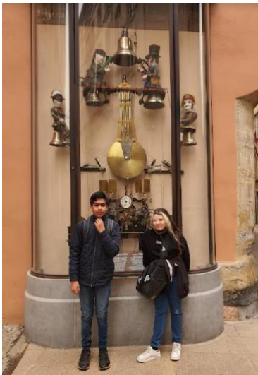
L'horloge de Guignol.