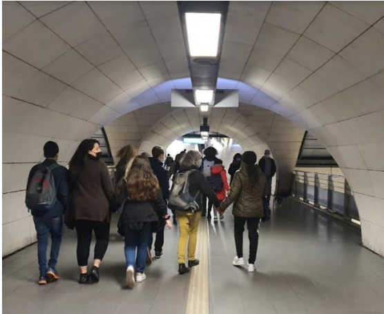
Le métro lyonnais.