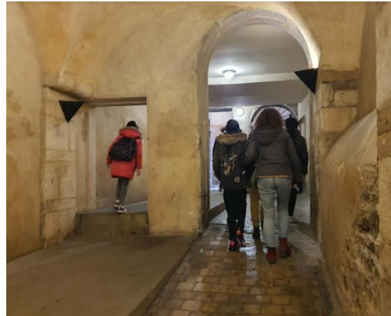
La longue traboule serpente à travers 4 immeubles.